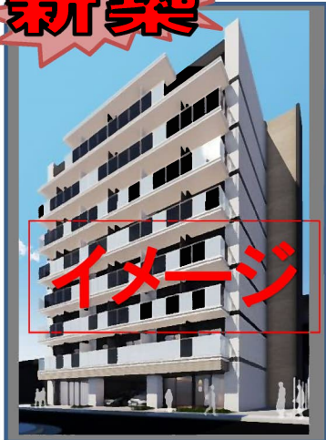
パース図と現状に相違がある場合は、現状を優先とします。