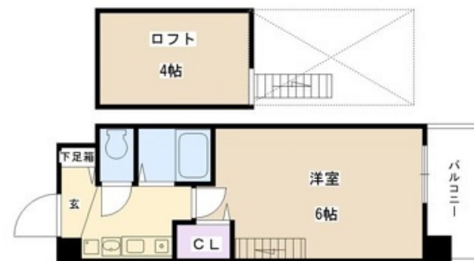
本図面及び方位は現状を優先します